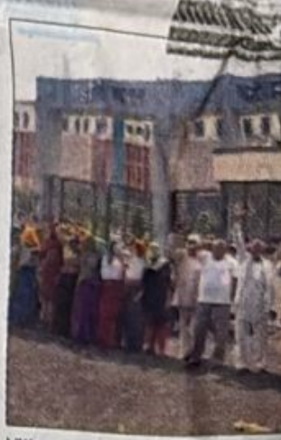
Villagers are already demanding Chyawan Medical College at K...

"A team from the National Medical Commission (NMC) recently visited the college to assess whether it meets the